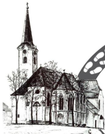
St. Leonhard am Forst